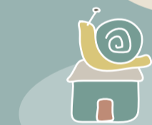
蕭王府來馬鎮居處 (塘岐社區發展協會)

1961年左右，信徒陸續籌資想幫蕭王爺與眾神明蓋廟，並商請北高指揮部支援。1971年於現址開始興建蕭王府，2003年因屋頂漏水嚴重，於現址重建，即為今蕭王爺府。